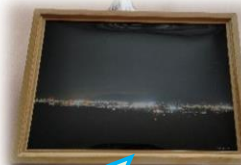
春日山城址銅像付近から (夜景の写真)

利用者の方が作成した作品を、つくしセンター憩いスペースにて展示しております。つくしセンターご利用の際は、ぜひご鑑賞ください。