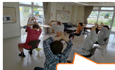
『第1回ヨガ教室』の様子

一般ヨガの他に、心身症、各疾患に対応した統合療法としてのヨガ療法を行われています。