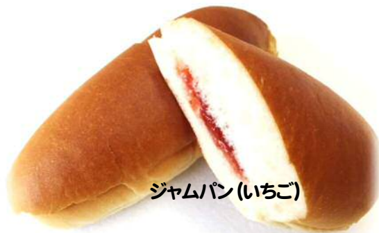
ジャムパン(いちご)