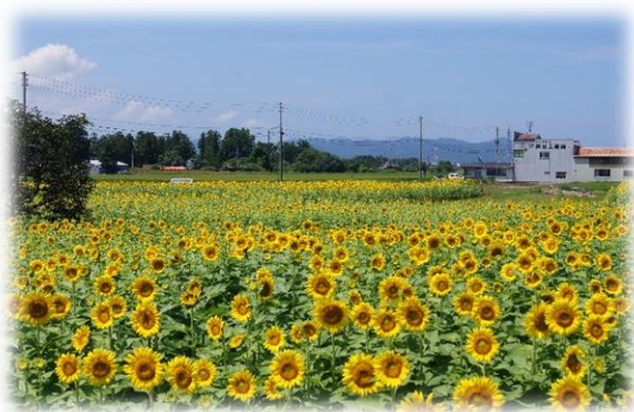
H28.8.4 ひまわり畑（上越市大字南新保字西野）