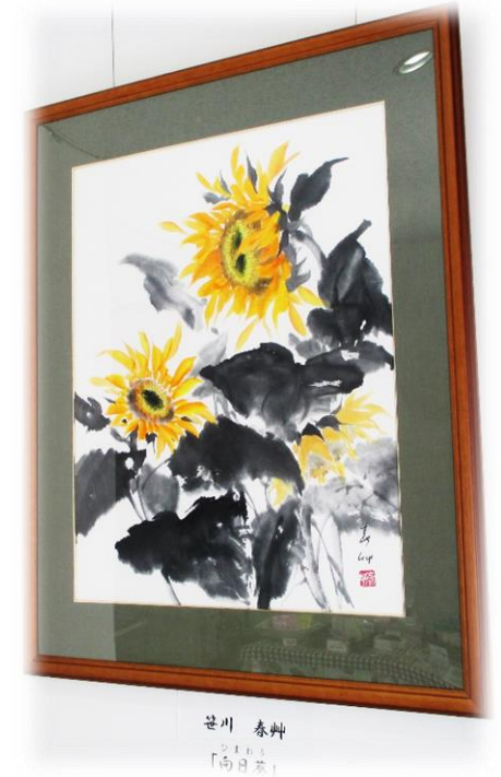
H29.3 笹川春艸先生による「向日葵」 （本町2つくしワークショップスペース）