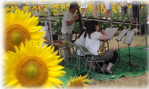
H25.8.9 ひまわり祭（新井吹奏楽団アンサンブル）

※ ひまわり畑の絵や写真を募集します。10月1日（日）に開催する「第17回はさ木フェスタ」にて展示・コンテストを予定しています。担当は川室記念病院（TEL 025-520-2021）です。