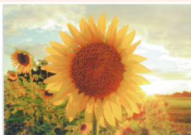
「夕日とヒマワリ畑」