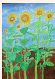
「げんきなひまわり」

ひまわりアート展今年も募集いたします 詳しくはチラシ・ホームページでご確認ください