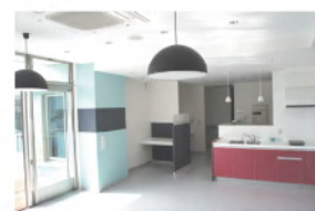
ショートステイデイルーム