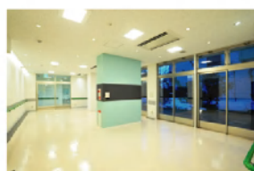
デイサービスルーム

小規模だから接する機会を多く持つことができ、利用者様との信頼関係を深めることができます。一人ひとりに対し、きめ細かいサービスを共に考え、実現に取り組みます。