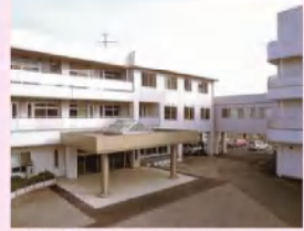
特養 いなほ園 ショートステイ デイサービス 居宅介護支援