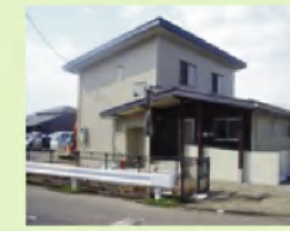
グループホーム つくしの里