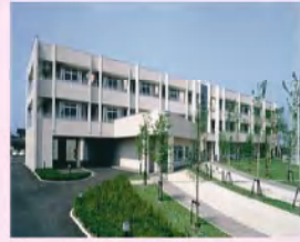
特養 新光園 ショートステイ デイサービス 地域包括支援センター