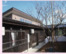
地域密着型施設 グループホーム4施設 小規模多機能型居宅介護