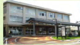
つくしワーク トレーニングルーム