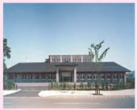
老健 高田の郷 デイケア 地域包括支援センター