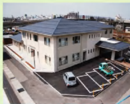
地域生活支援センター こまくさ