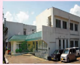
軽費老人ホーム 千寿園