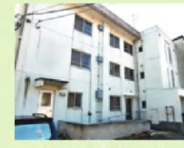
グループホーム サンハイツ